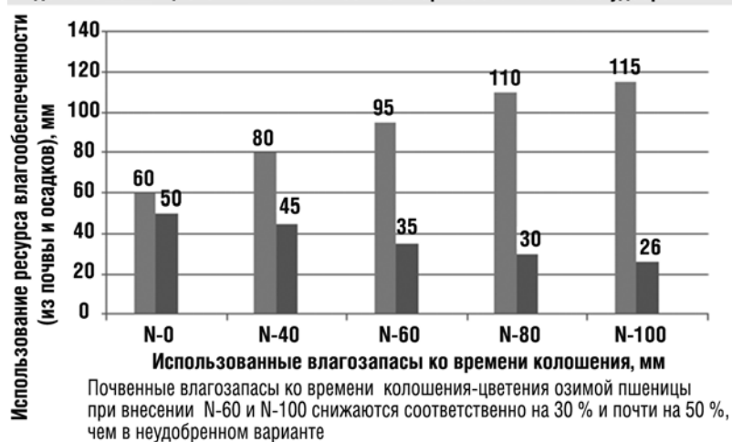
Водопотребление озимой пшеницы от возобновления вегетации до колошения-цветения в зависимости от норм азота в составе удобрения

калийные удобрения на количество возрастающей урожайности - как через почву, так и по листу. Если увлажнения нет, повторяется засуха, удобрения в принципе вредны, необходимо осуществлять только контроль за сорняками и вредителями. Фунгицидные обработки, как правило, в таких условиях также нецелесообразны. Безусловно, весьма непросто управлять ростом и развитием растений в критических или нестабильных погодных условиях, но результат того стоит. Для исключения наиболее грубых ошибок желателен современный аналитический подход с привлечением узких специалистов, ученых и лабораторий.