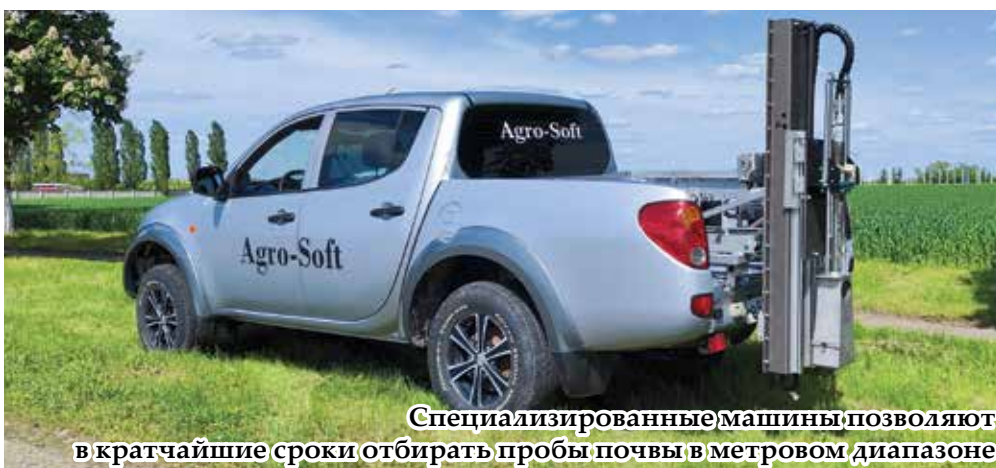
Специализированные машины позволяют в кратчайшие сроки отбирать пробы почвы в метровом диапазоне

ученый-агроном по защите растений