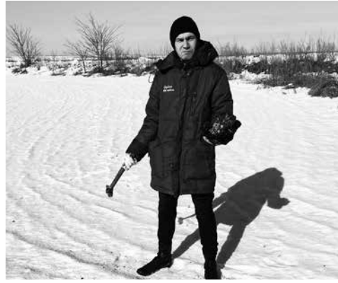
Отбор проб для определения состояния посевов озимых культур в период зимовки

Сев озимых зерновых по колосовым предшественникам, проводившийся на некоторых полях, способствует передаче инфекционного фона. При наличии в пахотном слое большого количества неразложившихся пожнивных остатков с осени складываются условия, благоприятствующие сохранению зимующего запаса возбудителей болезней зерновых культур — корневых гнилей, мучнистой росы, септориоза, сетчатой и тёмно-бурой пятнистостей ячменя. При переувлажнении почвы и установлении весной тёплой погоды с высокой влажностью воздуха прогнозируется широкое распространение заболеваний на посевах озимых, высеванных по колосовым. Кроме того, снежный покров будет способствовать развитию снежной плесени на недостаточно выровненных полях и загущенных посевах и мучнистой росы по краям полей в непосредственной близости от агролесомелиоративных насаждений, способствующих накоплению сдуваемого с центра полей снега. Сдерживающие обработки микробиологическими фунгицидами при прогнозируемом распространении болезней растений наиболее целесообразны, так как опти-