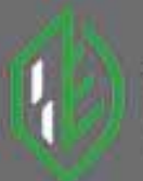
Фото из архива компании

ЭДЕЛЬВЕЙС-АГРО СЕЛЬСКОХОЗЯЙСТВЕННАЯ ТЕХНИКА · СЕРВИС